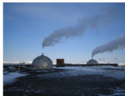
Fig.25.11: Mehr Geothermie in Island.

Tatsächlich exportiert Island bereits Energie, indem es Industrie unterhält, die energieintensive Produkte herstellt. Island produziert beispielsweise fast eine Tonne Aluminium pro Einwohner! Aus isländischer Sicht sind hier große Profite zu machen. Doch kann Island Europa retten? Es würde mich wundern, wenn Islands Energieproduktion so weit hochskaliert werden könnte, dass sie auch nur für die Nachbarn Irland oder England nennenswerte Elektrizitätsexporte tragen würde. Als Vergleichsskala nehmen wir einfach mal die Verbindungsleitung Frankreich-England, die 2 GW über den Ärmelkanal liefern kann. Diese Maximalleistung entspricht 0,8 kWh pro Tag pro Brite, etwa 5% des mittleren britischen Elektrizitätsbedarfs. Islands mittlere Geothermie-Stromleistung ist lediglich 0,3 GW, was unter 1% des britischen Durchschnitts-Stromverbrauchs liegt. Islands mittlere Elektrizitätsproduktion ist 1,1 GW. Um eine Verbindung mit Stromimporten vergleichbar mit denen aus Frankreich zu beschicken, müsste Island seine Stromproduktion verdreifachen. Um England mit 4 kWh/d/p zu versorgen (etwa der Anteil britischer Kernkraftwerke), müsste sich Islands Elektrizitätsproduktion verzehnfachen. Es ist wahrscheinlich eine gute Idee, eine Verbindungsleitung nach Island zu bauen, doch erwarten Sie nicht, dass darüber nennenswerte Beiträge fließen werden.