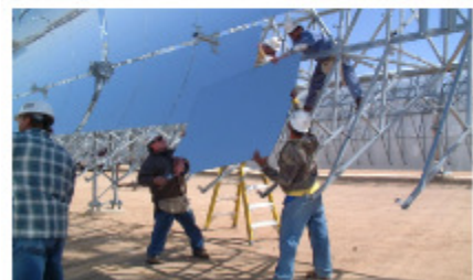
Fig.25.4: Andasol, Spanien – ein „100MW“ Solarkraftwerk in Bau. Übrige thermische Energie, die tagsüber produziert wird, wird in Flüssigsalztanks bis zu sieben Stunden gelagert, was eine kontinuierliche und stabile Netzversorgung gewährleistet. Das Kraftwerk soll voraussichtlich 350 GWh im Jahr (40 MW) liefern. Die Paraboltröge belegen 400 Hektar, die Leistungsdichte pro Landfläche ist also 10 W/m 2 .