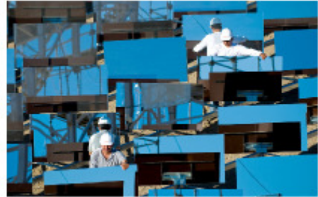
Fig.25.12: Zwei Ingenieure bauen ein eSolar-Kraftwerk mit Heliostaten (Spiegel, die sich drehen und neigen können um der Sonne zu folgen) auf. esolar.com stellt mittelgroße Kraftwerke her: eine 33MW(peak) Anlage auf 64 Hektar. Das sind 51 W/m 2 (peak), in typischer Wüstenlage könnten, würde ich schätzen, etwa 25% davon als Dauerleistung geliefert werden: 13 W/m 2 .