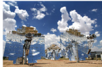
Fig.25.3: Stirling-Maschine. Diese formschönen Reflektoren liefern eine Leistungsdichte pro Landfläche von 14 W/m 2 .

Zum Glück ist die Sahara nicht die einzige Wüste, deshalb ist es vielleicht realistischer, die Welt in kleinere Regionen aufzuteilen und herauszufinden, welche Fläche jeweils in der lokalen Wüste einer solchen Region erforderlich wäre. Um sich also auf Europa zu konzentrieren: Welche Fläche in der nördlichen Sahara ist erforderlich, um jeden in Europa und Nordafrika mit dem mittleren europäischen Bedarf zu versorgen? Nehmen wir die Bevölkerung von Europa und Nordafrika zu 1 Milliarde an, geht der Flächenbedarf auf 340.000 km 2 zurück, was einem Quadrat von 600 km mal 600 km entspricht, ist ziemlich genau der Fläche von Deutschland.