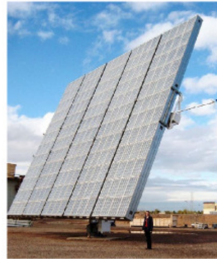
Fig.25.9: Ein 25 kW(peak) PV-Kollektor mit Lichtbündelung des kalifornischen Herstellers Amonix. Eine 225 m 2 Lichtfläche enthält 5760 Fresnellinsen mit einer optischen Konzentration von x 260, von denen jede eine 25%-effiziente Siliziumzelle beleuchtet. In einer geeigneten Wüstengegend liefert dieser Kollektor 138 kWh pro Tag, genug für den Energiekonsum eines halben Amerikaners. Beachte den Menschen als Größenvergleich.

Ein anderer Ansatz, ein Gefühl für die erforderliche Anlagenhardware zu bekommen, ist, sie zu personalisieren. Einer der „25 kW“(peak) Kollektoren (Fig.25.9) erzeugt im Mittel 138 kWh pro Tag; der amerikanische Lebensstil verbraucht aktuell 250 kWh pro Tag pro Person. Um die USA mit Solarkraft frei von fossilen Brennstoffen zu machen, bräuchte man also etwa zwei dieser 15 m x 15 m Kollektoren pro Person.