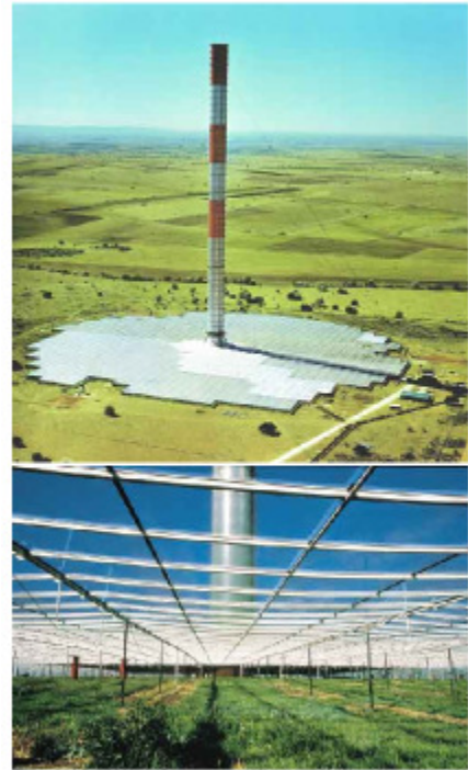
Fig.25.10: Der Thermikkraftwerk-Prototyp in Manzanares.

Ein Thermikkraftwerk nutzt Sonnenkraft auf sehr einfache Weise. Ein großer Kamin wird in der Mitte einer Fläche errichtet, die mit einem durchsichtigen Dach aus Glas oder Folie überdacht wird. Weil warme Luft aufsteigt, zieht die Luft, die wie in einem Glashaus unter dem Dach erwärmt wird, im Kamin nach oben und kältere Luft strömt am äußeren Rand der überdachten Kollektorfläche nach. Aus diesem Luftstrom wird durch eine Turbine am Fuß des Kamins Energie erzeugt. Thermikkraftwerke sind relativ einfach aufzubauen, doch liefern sie nicht sehr beeindruckend viel Leistung pro Flächeneinheit. Eine Pilotanlage in Manzanares, Spanien, war sieben Jahre von 1982 bis 1989 in Betrieb. Der Kamin hatte eine Höhe von 195 m und einen Durchmesser von 10 m. Der Kollektor hatte einen Durchmesser von 240 m, sein Dach eine Fläche von 6.000 m 2 Glas und 40.000 m 2 Plastikfolie. Sie erzeugte 44 MWh pro Jahr, was einer Leistungsdichte pro Flächeneinheit von 0,1 W/m 2 entspricht. Theoretisch wird die Leistung eines Thermikkraftwerks um so höher, je größer der Kollektor und je höher der Kamin ist. Die Ingenieure von Manzanares rechneten hoch, dass ein 1000 m hoher Kamin umgeben von einem Kollektor mit 7 km Durchmesser eine Leistung von 680 GWh pro Jahr erzeugen könnte. Das ist eine Leistungsdichte pro Landfläche von etwa 1,6 W/m 2 ,