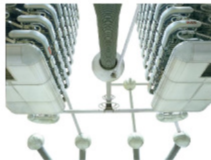
Fig.25.13: Eine HVDC Anlage in China.

European Commission (2007), German Aerospace Center (DLR) Institute of Technical Thermodynamics Section Systems Analysis and Technology Assessment (2006), www.solarmillennium.de .