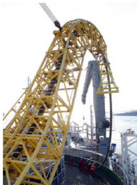
Fig.25.7: Verlegen eines HVDC Kabels zwischen Finnland und Estland. Ein solches Kabelpaar überträgt 350 MW Leistung.

Tabelle 25.6 zeigt die DESERTEC-Schätzungen für das Potential an Kraftwerksleistung, das in den jeweiligen Ländern Europas und Nordafrikas vorhanden ist. Dieses „ökonomische Potential“ summiert sich zu mehr als nötig ist, um 1 Milliarde Menschen mit 125 kWh/d/p zu versorgen. Das gesamte „Küstenpotential“ reicht für 16 kWh/d/p für eine Milliarde Menschen. Lassen Sie uns an Hand einer Karte entwickeln, wie ein realistischer Plan aussehen könnte. Nehmen wir an, wir bauen Solaranlagen mit je 1.500 km 2 Größe – das ist fast zweimal die Größe von Berlin (Berlin umfasst etwa 890 km 2 ) oder fünfmal das Stadtgebiet München (München umfasst 310 km 2 , der Landkreis München hat 670 km 2 . Der Münchner