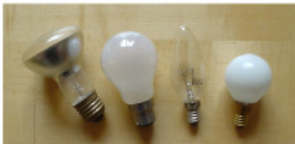
Fig.2.1: Unterscheidung von Energie und Leistung: Jede dieser 60 Watt-Lampen hat 60 Watt Leistung, wenn sie an ist; sie hat nicht eine „Energie“ von 60 W. Sie benutzt 60 W elektrischer Leistung und emittiert 60 W Leistung in Form von Licht und Wärme (hauptsächlich letzteres).

◦Die meisten Diskussionen um Energieverbrauch und -produktion verwirren schon allein wegen ihrer ausufernden Vielfalt von Einheiten, in denen Leistung und Energie gemessen werden, von „Tonnen Rohöläquivalent“ bis „Terawattstunden“ (TWh) und Exajoule (EJ). Niemand außer den Spezialisten hat ein Gefühl dafür, was „ein Barrel Öl“ oder „Eine Million BTUs“ in menschlichen Begriffen bedeuten. In diesem Buch werden wir alles in einem einheitlichen Set personalisierter Einheiten beschreiben, unter denen sich jeder etwas vorstellen kann. ♦In der Schnellreferenz (Anhang J) sind zudem viele Umrechnungsfaktoren zusammengetragen, die Ihnen helfen können, unvorstellbare Einheiten in greifbare zu übersetzen.◦